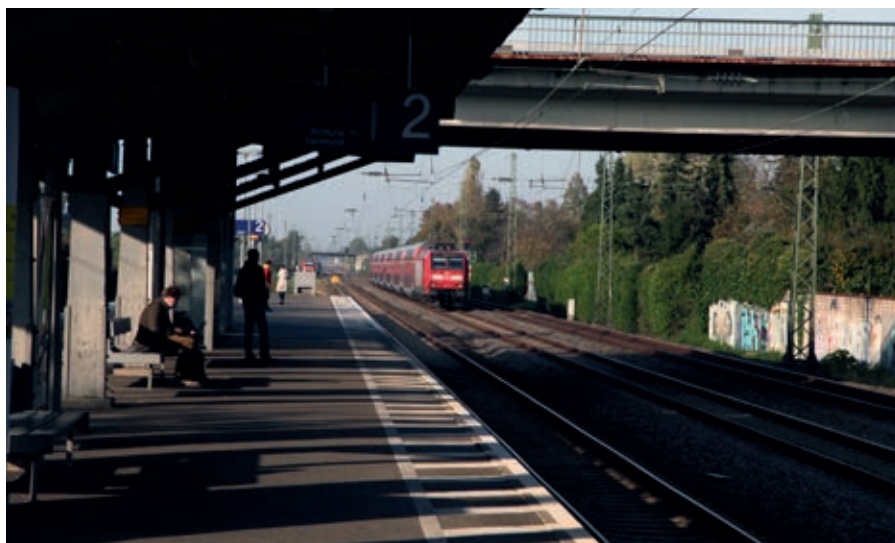
Haltepunkt Angermund: Blick Richtung Norden.

Die Schalltechnische Untersuchung wird derzeit auf Grundlage des Stadtratsbeschlusses von 2018 überarbeitet. Die detaillierten Ergebnisse (z. B. Pegellisten je Gebäude, Fassade und Stockwerk) liegen vsl. bis Ende 2019 vor.