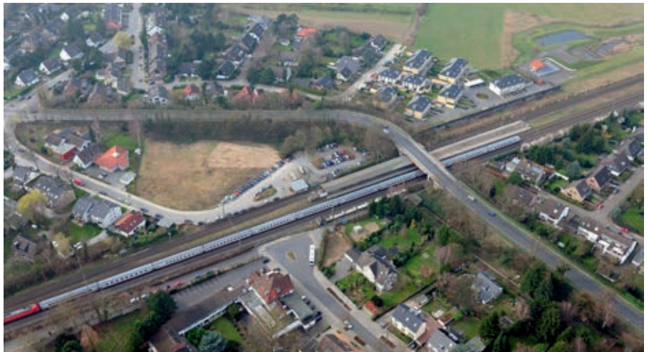
Die heutige Situation am Haltepunkt Angermund.

Aufgrund der Ausbaumaßnahmen muss der bestehende Bahnsteig für die S-Bahn in Richtung Westen versetzt werden. Die Infrastrukturerweiterung erfordert den Neubau der Personenunterführung. Diese wird mit optimier-