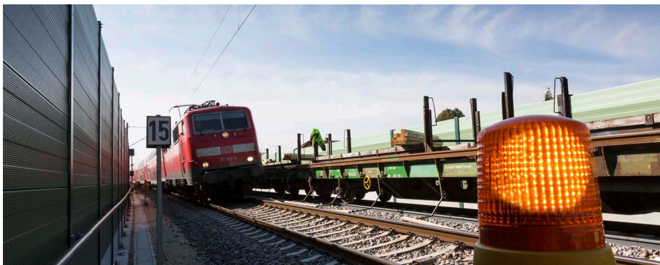
Im PFA 3.2a werden insgesamt 4,5 Kilometer Schallschutzwände gebaut (Symbolbild).

den Duisburger Hauptbahnhof zu optimieren. Durch diese Anpassung müssen auch Eisenbahnbrücken über Straßen umgebaut werden. Hier handelt es sich im Wesentlichen um die Bauwerke über die Wacholderstraße, den Sternbuschweg (B 8) und die Karl-Lehr-Straße.