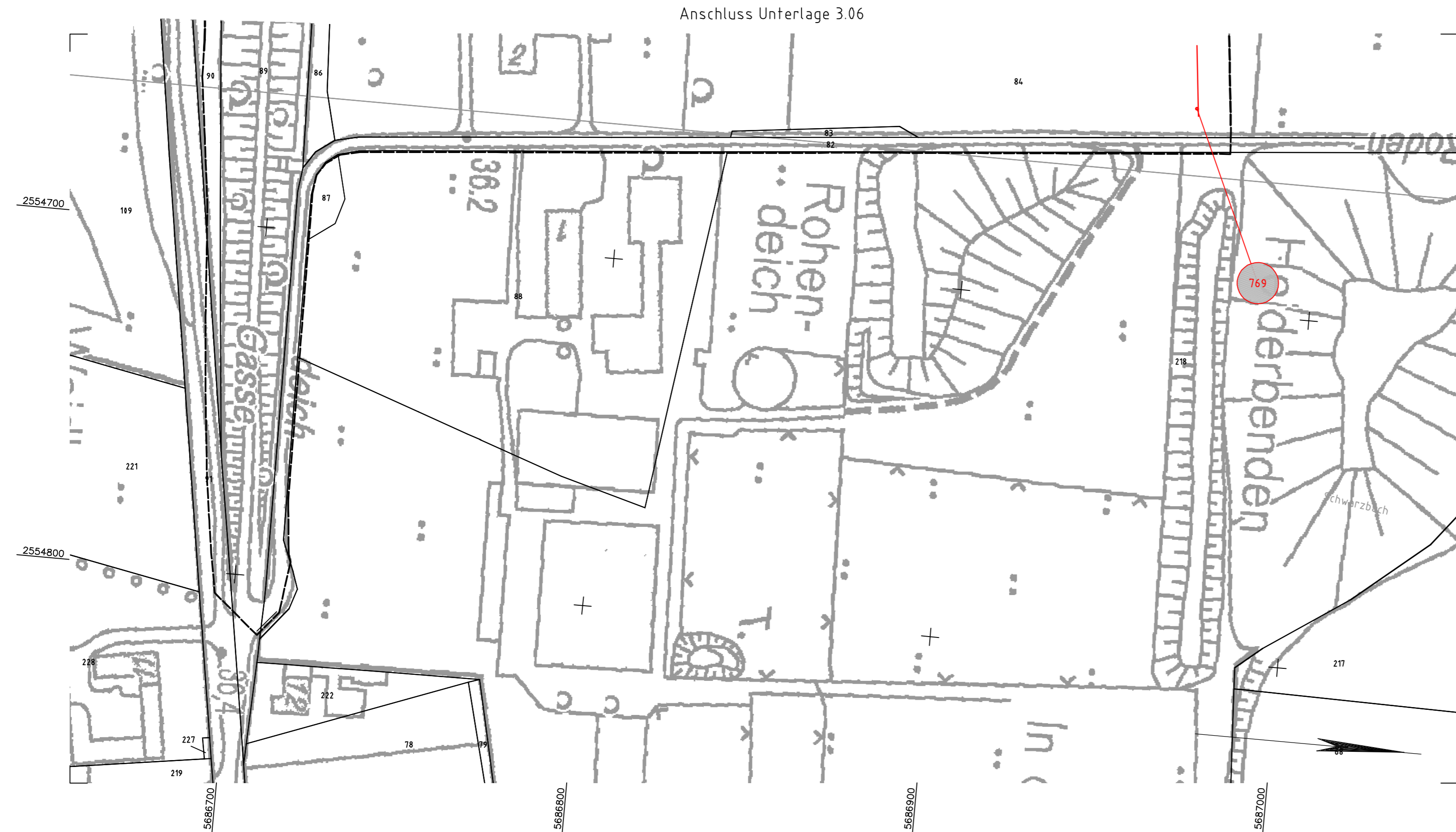
Anschluss Unterlage 3.06