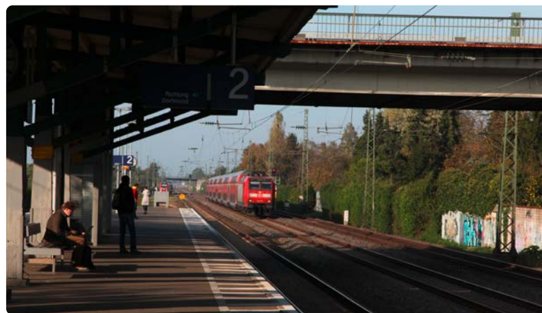
Haltepunkt Angermund: Blick Richtung Norden

Dort, wo aktive Maßnahmen aus technischen, wirtschaftlichen oder auch topografischen Gründen nicht realisiert werden können oder ihre Wirkung nicht ausreicht, um die gesetzlich vorgeschriebenen Immissionsgrenzwerte vollständig einzuhalten, kommt im PFA 3.1 ergänzend der passive Schallschutz zum Einsatz.