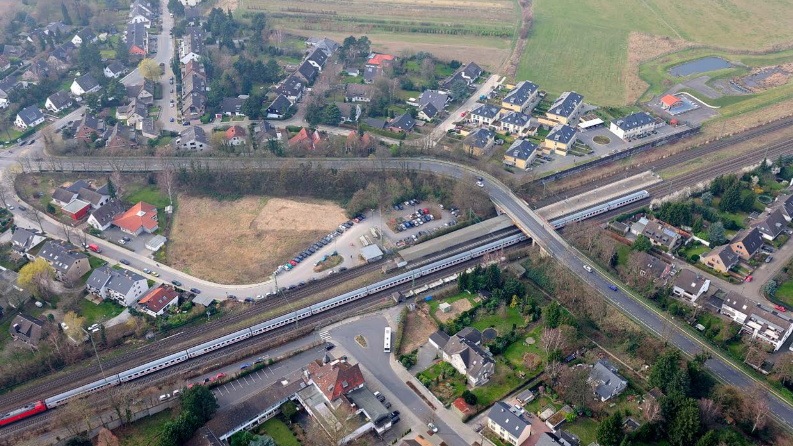
Der Haltepunkt Angermund hat derzeit noch vier Gleise (Archivfoto).