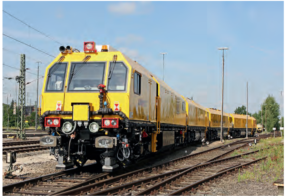
Besonders überwachtes Gleis: Ein Schleifzug glättet die Schienen.

Im PFA 3.2 ist im Ausbaubereich eine Kombination aus aktivem und passivem Schallschutz vorgesehen. Als aktive Maßnahmen werden Schallschutzwände mit einer Gesamtlänge von rund 6,2 Kilometern und einer